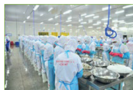
Fábricas de alimentos