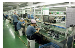
Fábricas de electrónicos